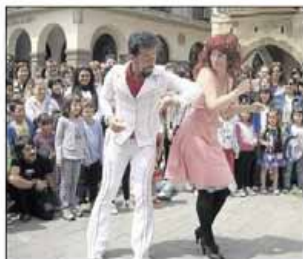
Los más pequeños y sus familias disfrutaron de los espectáculos de teatro en las calles de Vila-real FRANCISCO POYATO